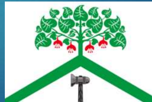
Флаг городского округа