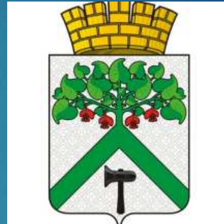
Герб городского округа

Исполнительно-распорядительный орган Верхнесалдинского городского округа, наделенный Уставом Верхнесалдинского городского округа полномочиями по решению вопросов местного значения и полномочиями по осуществлению отдельных государственных полномочий, переданных ему федеральными законами и законами Свердловской области.